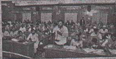
ವಿಧಾನಸಭಾ ಅಧಿವೇಶನ ಸ್ಪರ್ಧೆಯ ಚರ್ಚೆಯಲ್ಲಿ ಭಾಗವಹಿಸಿರುವ ವಿದ್ಯಾರ್ಥಿಗಳು.