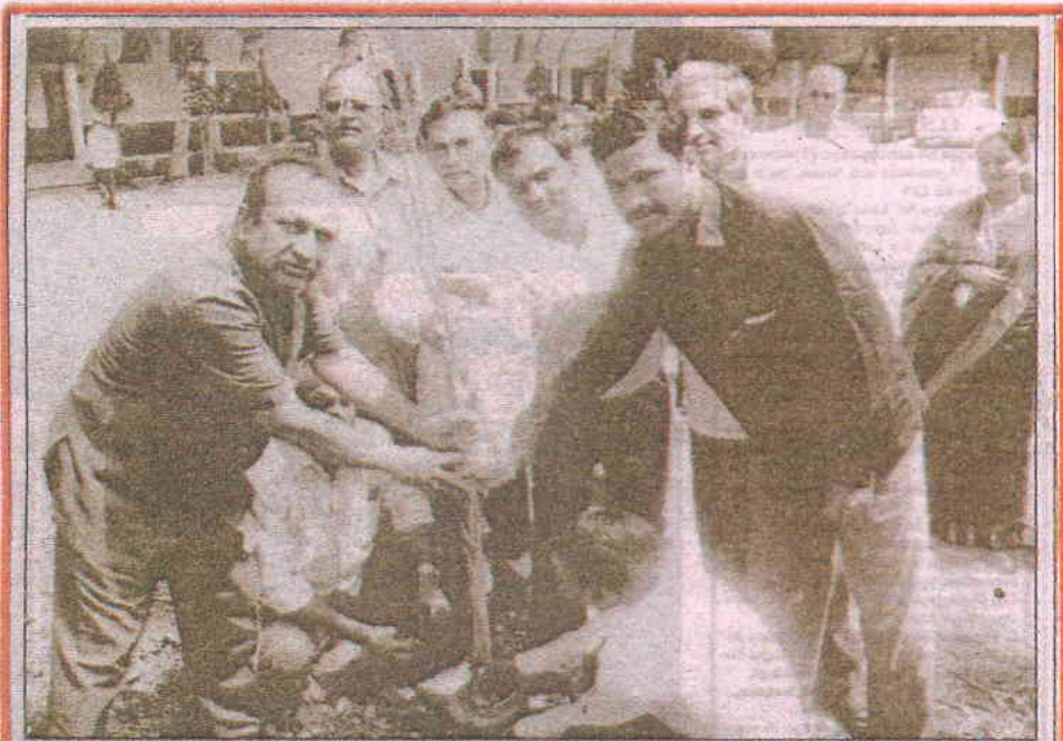
ಕಲಬುರ್ಗಿ ನಗರದ ಸಿದ್ಧಾರ್ಥ ಕಾನೂನು ಮಹಾವಿದ್ಯಾಲಯದಲ್ಲಿ ಆಯೋಜಿಸಿದ್ದ ರಾಷ್ಟ್ರೀಯ ಸೇವಾ ಯೋಜನೆಯ ಸಮಾರೋಪ ಸಮಾರಂಭದಲ್ಲಿ ಗಣ್ಯರು ಸಾ ನೆಚ್ಚಿದರು.