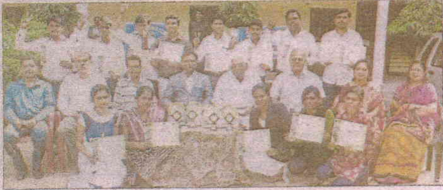
ರಾಯಚೂರಿನ ಎಸ್.ಎ.ವಿ.ಐ ಕಾನೂನು ಕಾಲೇಜಿನಲ್ಲಿ ಈಚೆಗೆ ಹಮ್ಮಿ ಕೊಂಡಿದ್ದ ಅಂತರ ಕಾಲೇಜುಗಳ ಯುವಜನೋತ್ಸವದಲ್ಲಿ ಕಲಬುರಗಿಯ ಸಿದ್ಧಾರ್ಥ ಕಾನೂನು ಕಾಲೇಜಿನ ವಿದ್ಯಾರ್ಥಿಗಳು 4 ಚಿನ್ನ, 4 ಬೆಳ್ಳಿ ಪದಕ ಪಡೆದಿದ್ದಾರೆ.